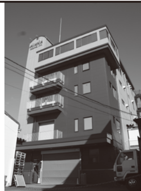
ニッカテクノ様 ワインダービル