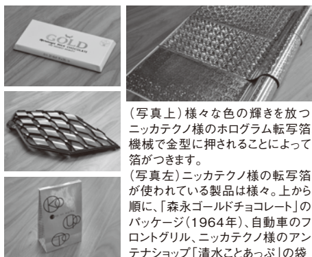
(写真上) 様々な色の輝きを放つ、ニッカテクノ様のホログラム転写箔。機械で金型に押されることによって箔がつきます。 (写真左) ニッカテクノ様の転写箔が使われている製品は様々。上から順に、「森永ゴールドチョコレート」のパッケージ(1964年)、自動車のフロントグリル、ニッカテクノ様のアンテナショップ「清水ことあつぷ」の袋